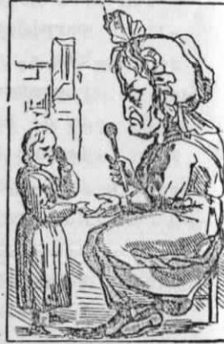
Moeder Kinderschrik gooit van de plank naar de granaatoren. M me Croquemitaine donne la fêle aux petites filles qui jurent trop.