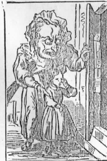
Moeder Kinderschrik sluit de ongehoorzame meisjes in den rattentoren op. M me Croquemitaine renferme les petites filles désobéissantes dans la tour aux rats.