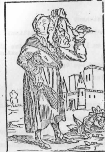
Moeder Kinderschrik bestrafst de kleine luiaards. M me Croquemitaine corrige les petits fainéants.