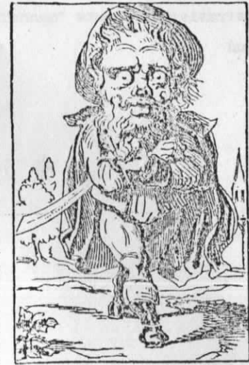
Daan Kinderschrik komt de boeze kinderen langs den schoorsteen halen. M. Croquemitaine descend par la cheminée pour prendre les enfants qui ne sont pas sages.