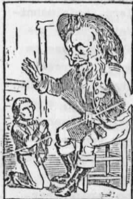
Vergeef! vergeef! heer Kinderschrik, ik zal mijn kind. Pardoni! pardoni! M. Croquemitaine, je serai bien sage.

Ter illustratie: enkele fragmenten Turnhouts 'mannekenpapier', de voorloper van het stripverhaal, i. v. m. kinderschrik.