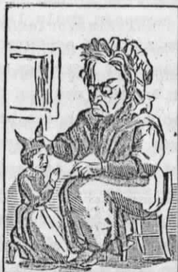
Moeder Kinderschrik stelt aan een lui meisje de rekstap op het hoofd. M me Croquemitaine met le bonnet d'une à une petite paresseuse.