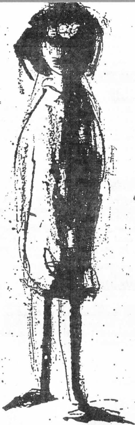
G. Aerts Ontheemd meisje O.I. inkt, lapis