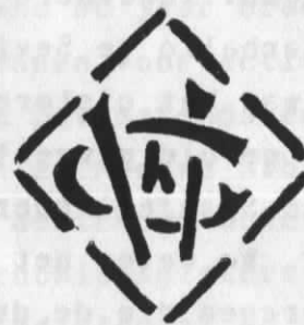
de initialen van H.Gysbrechts-Wouters, ware grootte

Maar ook de 2 exemplaren die in het museum Tempelhofte Beerse bewaard worden zijn het vermelden waard.