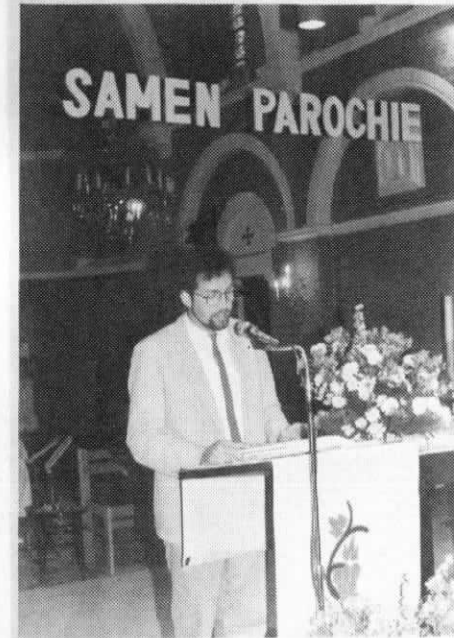
Foto : De auteur bij zijn uiteenzetting tijdens de voorstelling van het boek.