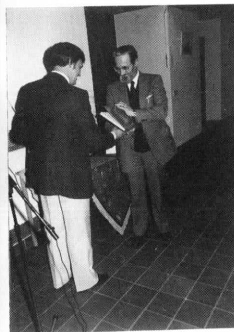
Foto : De burgemeester mag eveneens het allereerste exemplaar van "Oud-Turnhout en zijn verleden II" in ontvangst nemen. Politiek heeft dus wel degelijk zijn verdiensten ...