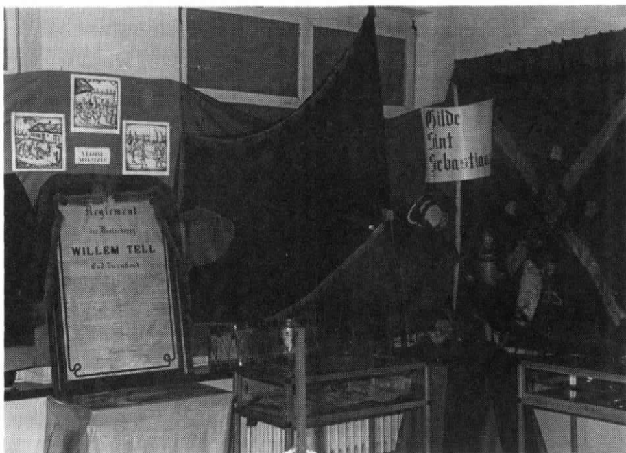
Foto : Het hoekje van de tentoonstelling dat door de Sint-Sebastiaansgilde uit Oud-Turnhout werd verzorgd.