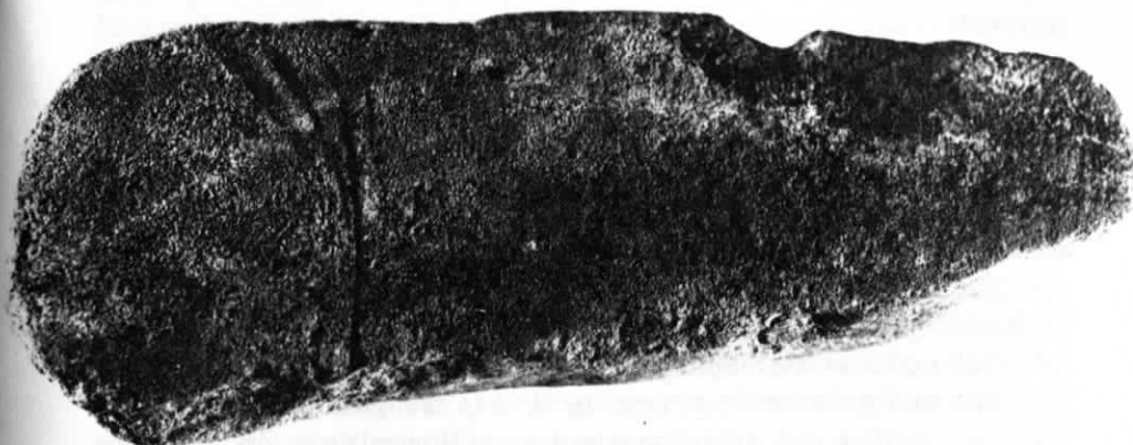
Afbeelding : De gevonden zandsteen.