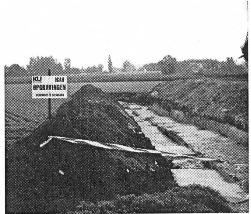
De vindplaats op het Heieinde tijdens de opgravingswerken.

De systematische opgraving van onze lange sleuf (50 x 4 meter) maakte al snel duidelijk dat erg weinig werktuigen in de erosielaag achtergebleven waren, gemiddeld nog niet 1 per vierkante meter. De kleinere stukjes waren naar alle waarschijnlijkheid verder hellingafwaarts vervoerd en zijn misschien in de rivierbedding terecht gekomen. Maar daarenboven bleek dat naar het noorden toe de concentratie van stenen AFnam, in plaats van toe te nemen of op zijn minst dezelfde te blijven. Dit laatste zou men namelijk