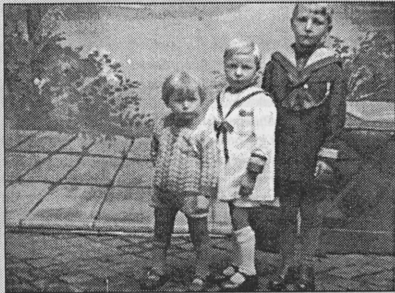
Klederdracht kort na wereldoorlog I

Dat was ook de tijd dat wij voor het eerst naar de haarkapper werden gesleurd en werden onze krullen afgeknipt en kregen wij ne jongenskop.