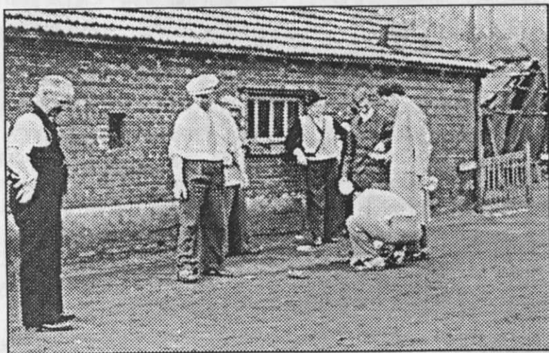
Naast "Steentje tik" en "Metje steek" was "Paap gooien" ook een populair familiaal zondagnamiddagspel.