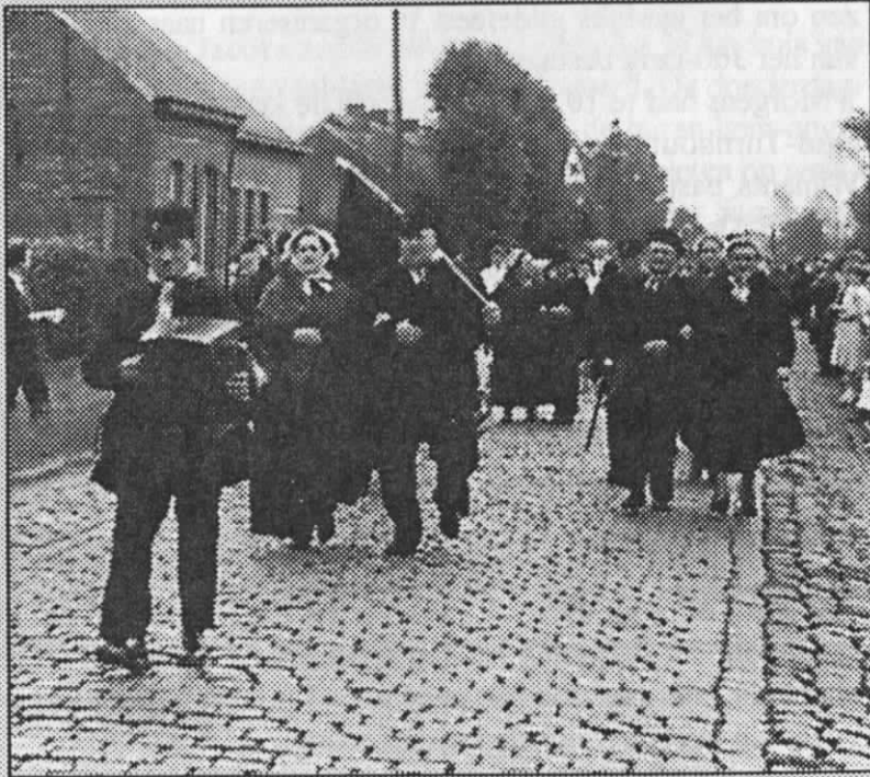
Optocht van de Oud-Turnhoutse "Sint-Sebastiaansgilde" ter hoogte van de steenweg op Mol, tijdens de Gildefeesten in 1959. Dergelijke folklorische tafereelen ziet men helaas niet veel meer.

De burgemeester heette allen welkom en bijzonder de afgevaardigden van de Nederlandse gilden. Hij huldigde de leiding van de feestvierende St.-Sebastiaansgilde die met zoveel ijver deze heuglijke feesten heeft voorbereid. Hij was gelukkig dat de raad haar geldelijke steun niet had onthouden en 20.000 fr. had uitgetrokken op de begroting om deze plechtigheid mogelijk te maken. Hij wenste het feestverloop het beste toe en dronk op het heil van de 300-jarige St.-Sebastiaan.