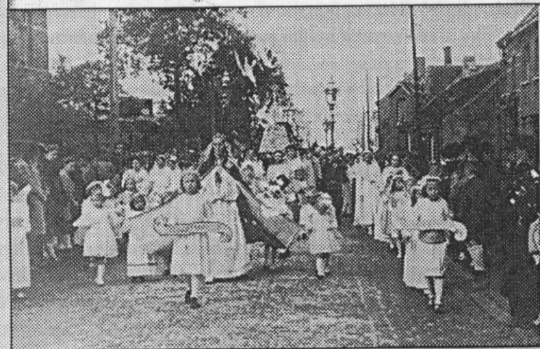
Sfeerbeelden van de Oud-Turnhoutse processie in de jaren '50 Bovenste foto aan de jongensschool in de V.D. Bekenlaan. Onderste foto ter hoogte van de verkeerlichten in het dorp.

zeer levendig gehouden, want wie stierf met een doodzonde ging recht naar de hel, de overigen moesten eerst langs het vagevuur passeren om te boeten voor hun zonden. Deze boeten kon men afkopen door voor de afgestorven familieleden missen te laten doen. Voor deze missen moest men natuurlijk betalen. De dagelijkse missen ( twee) werden steeds voor een overledene gedaan. Achter in de kerk stond er ook een offerblok, (waar men geld instak) voor de zieltjes van het vagevuur. Men kon eveneens aflaten bekomen door het prevelen van schietgebedjes. Ja, de mensen waren diepgelovig en durfden met het geloof niet spotten, heel anders dan nu.