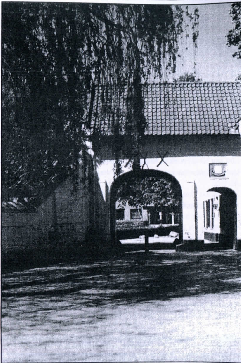
De 17de eeuwse ingangspoort der Postelse Abdy.