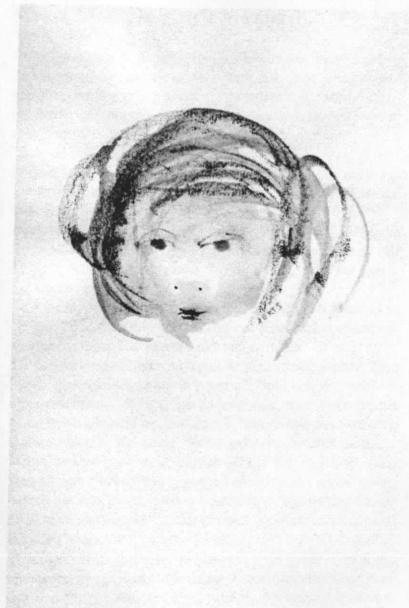
Kinderkopje, aquarel van G. Aerts (2000)