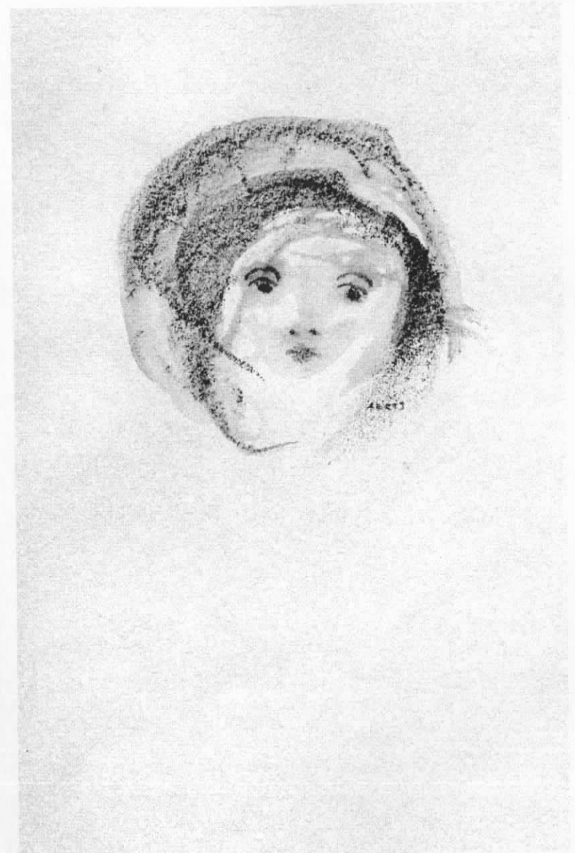
Kinderkopje, aquarel van G. Aerts (2000)