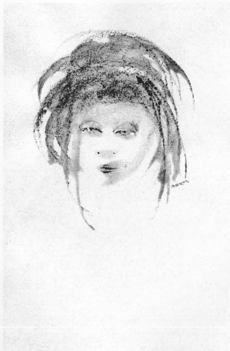
Kinderkopje, aquarel van G. Aerts (2000) (1)

In het ledentijdschrift Corsendonca - nr 3, 1988, - nr 3, 1990, - nr 2, 1994, - nr 4, 1995, - nr 1, 1996, - nr 4, 1997, - nr 4, 2000.