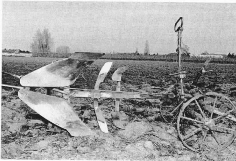
Achter deze thans ouderwetse ploeg hebben onze landbouwers heel wat kilometers afgelegd.