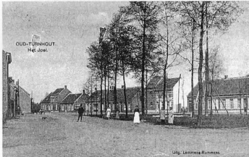
Het dorpsplein "De Doelen" rond 1920