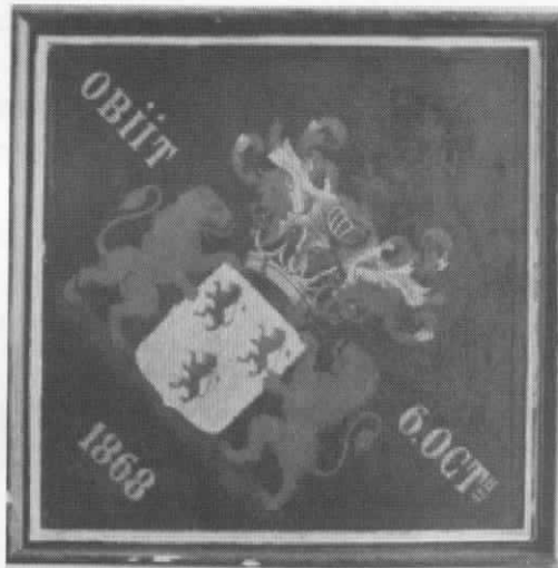
OBIIT Van der Beken-Pasteel