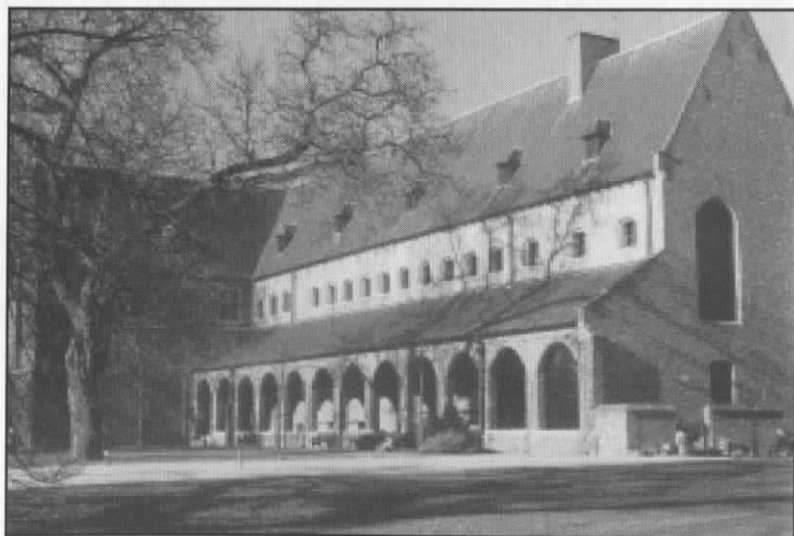
Corsendonk na de restauratie