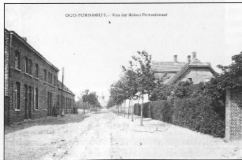
De 'Van der Bekenlaan' rond 1920

Onze Van der Bekenlaan is niet zo maar een gewone straat. Ze begint aan de voet van het geklasseerde oude gedeelte van ons gemeentehuis, en loopt kaarsrecht naar één van de oudste Kempische gotische torens, de toren van de geklasseerde Sint-Bavokerk. De grondvesten van deze toren dateren van de 14 de eeuw. Hoe je de straat ook inrijdt, recht voor je heb je steeds een monumentaal gebouw met geschiedenis. Ook de straatnaam zelf heeft zijn verhaal. Het woord 'laan' slaat terug op een weg met één of meer rijen bomen beplant. Bij de aanleg van de weg (begin 20 ste eeuw) kreeg de straat een aanplanting van wilde kastanje en inlandse eik. Later werden deze bomen vervangen door bolacacia. Deze werden in de jaren '70 op hun beurt ver-