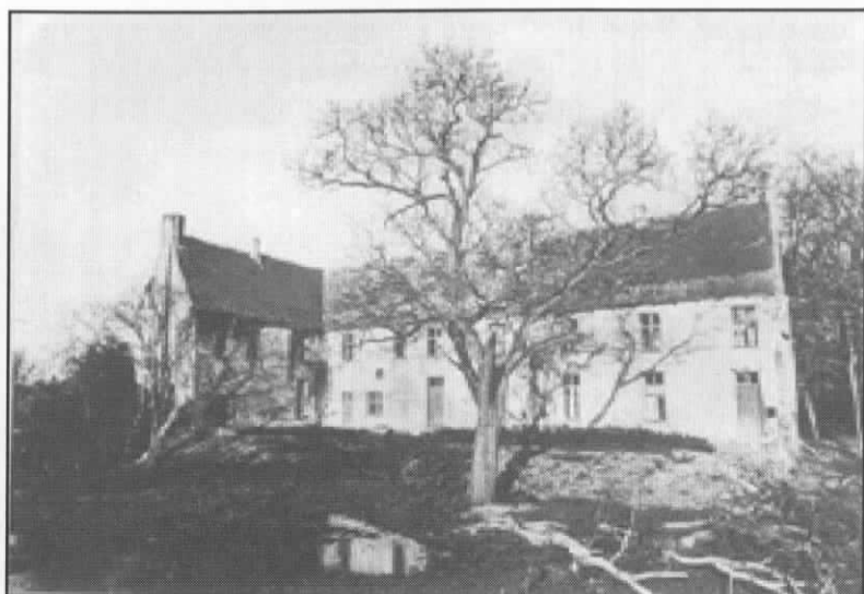
Corsendonk vóór de restauratie