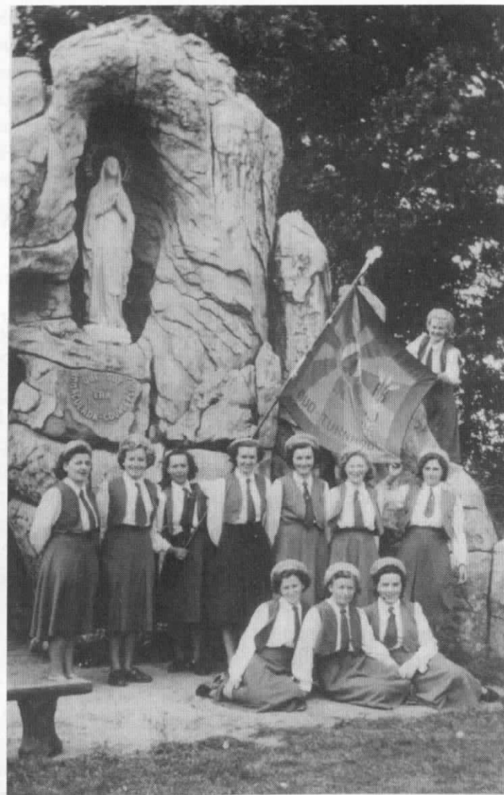
Foto 57. De B.J.B. meisjes aan de grot van Zwaneven in uniform en mer vlag.