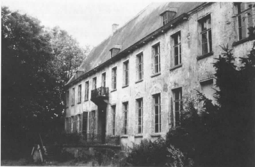
Priorij Corsendonk vóór de restauratie